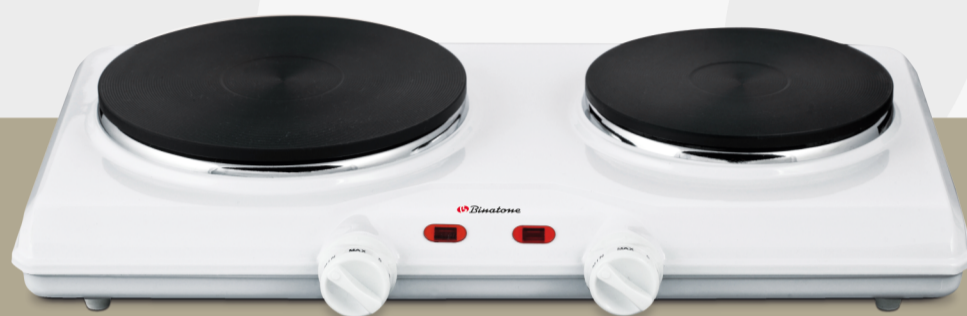
НАСТОЛЬНАЯ ЭЛЕКТРИЧЕСКАЯ ПЛИТКА Модель НРС1 204 W

Благодарим Вас за приобретение электроплитки Binatone. Мы надеемся, что качество ее работы доставит Вам удовольствие. Перед использованием прибора внимательно ознакомьтесь с инструкцией.